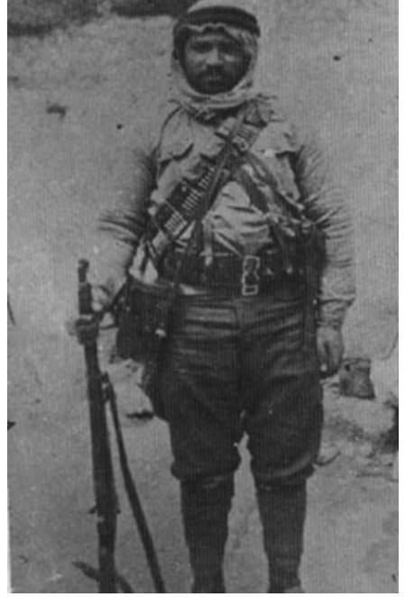
الشهيد القائد يوسف أبو درة